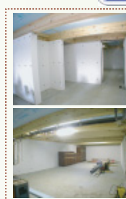
一階床下の収納部分です。20帖近く取れます

インターネットで気軽に見る。 http://land-home.cc ランド 名古屋市北区 検索